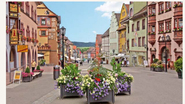
Hauptstraße in Rottweil, Foto: Tourist-Information Rottweil

Nachdem wir unser mitgebrachtes Rucksackvesper verzehrt haben, wandern wir auf einem Hangweg mit Ausblicken ins Eschachtal zum Rottweiler Ortsteil Bühlingen. Unser Ziel ist die historische Innenstadt von Rottweil. In der sehenswerten Fasnetshochburg, die zugleich älteste Stadt Baden-Württembergs ist, erwartet uns ein einstündiger informativer Stadtrundgang.